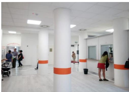
Via Silvio Pellico 19 Casa della Salute Valdese