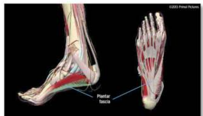
Figure 1: Anatomy of the plantar fascia and the windlass mechanism

E' importante quindi lavorare in rete con altri professionisti come il fisioterapista, l'ortopedico, il fisiatra per un trattamento più completo”.