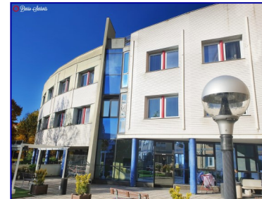
Drive through Ospedale Martini