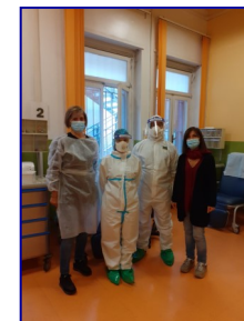
Hotspot via Le Chiuse